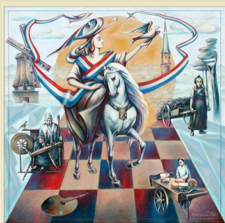
Op Weg Naar De Nieuwe Gouden Eeuw Serob Darbinian 2005 100x100