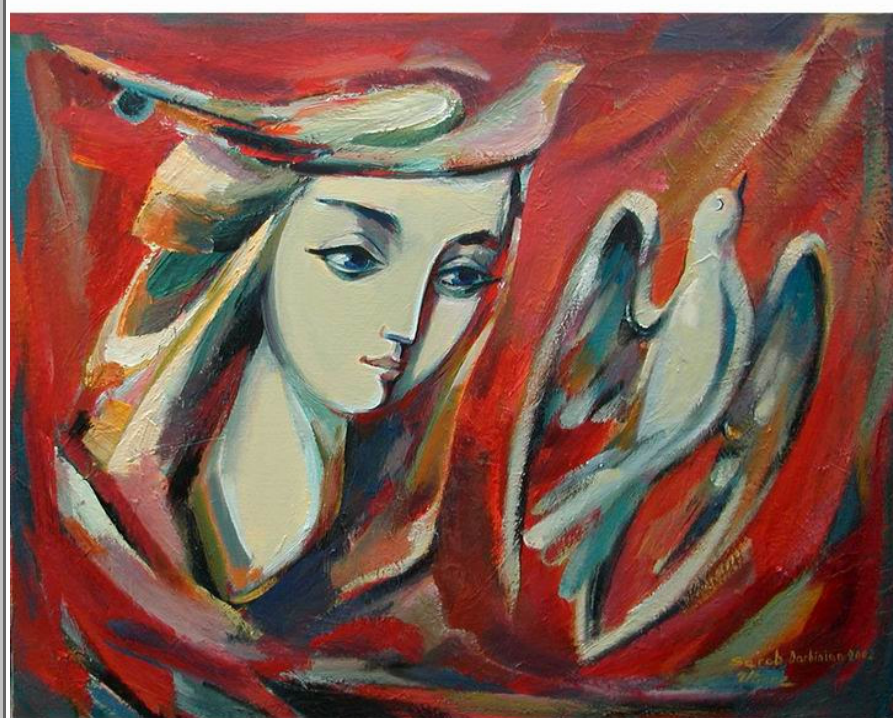
Bron van Inspiratie Maat: 70 x 90

Elk gecreëerd werk heeft zijn eigen geestelijk begin. Als wij Gods wijsheid tot ons nemen en accepteren, ontstaan er in ons een bron van inspiratie vervuld met de Heilige Geest. De wijsheid van God die nu in ons is Komt terug in onze kunstwerken. De duif (symbool van de Heilige Geest) moet aanwezig zijn in ons en om ons heen. Zoals door de Heilige Geest een begin ontstond met de geboorte van Jezus Christus