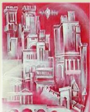
'Het verloren paradijs'

viewer klik op de foto voor toelichting: